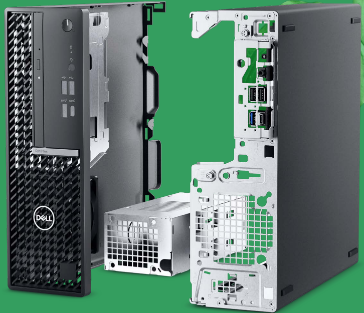
Een kijkje binnenin: Post-industrieel gerecycleerd staal

Het OptiPlex-team werkt gepassioneerd aan het verkleinen van de koolstofvoetafdruk van onze producten. Zo helpen we onze klanten om een positieve impact te maken op de toekomst. We streven naar circulair ontwerp gedurende de hele levenscyclus en stimuleren innovatief gebruik van materialen, verpakkingen, energiebesparing, recycling en zelfs reparatiebaarheid.