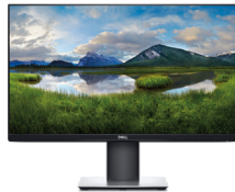
ÉCRAN DELL 24 POUCES - P2419H

Améliorez vos performances et votre productivité quotidiennes avec le clavier et la souris sans fil, qui arborent un design élégant, compatible avec la plupart des espaces de travail.